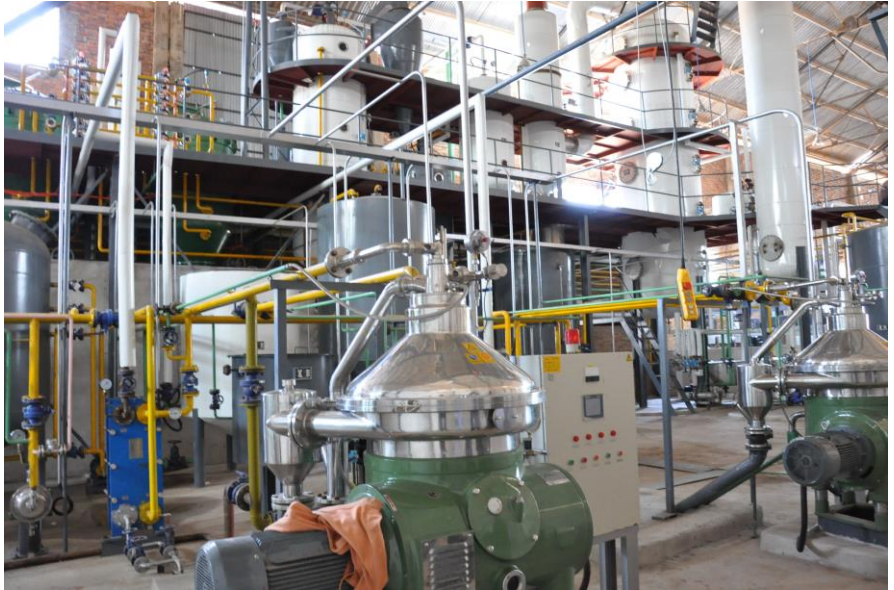
Mradi wa Kiwanda cha kukamua mafuta ya Alizeti kinachojengwa nje kidogo ya mji wa Dodoma.