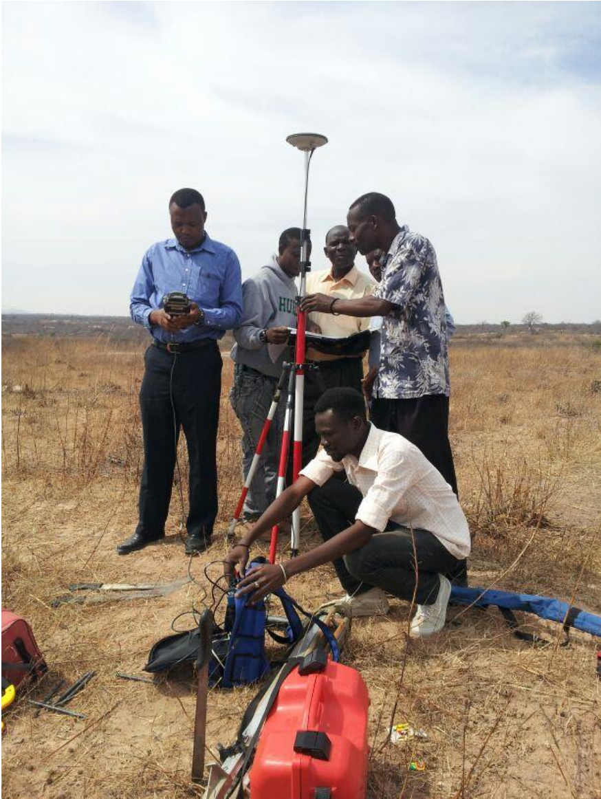
Wafanyakazi wa Mamlaka ya Ustawishaji Makao Makuu (CDA) wakipima viwanja kwa kutumia vifaa vya kisasa