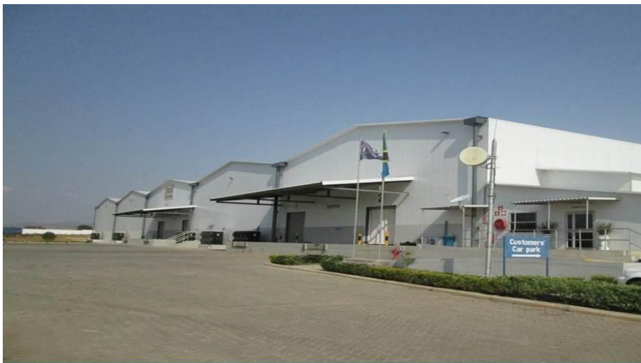
Moja ya ghala la Bohari Kuu ya Dawa kwa ajili ya kuhifadhi Dawa katika Kanda

50. Kwa kuzingatia dhamira ya kuwa na wananchi wenye afya bora watakaoweza kushiriki katika shughuli mbalimbali za kiuchumi na kutoa huduma katika miaka mitano ijayo, Chama Cha Mapinduzi kitaielekeza Serikali kuendelea kuhakikisha kwamba wananchi wanapata huduma bora za afya kwa kufanya yafuatayo:-